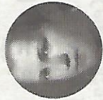
Josipina Turnograjska 1833-1854