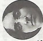
Zofka Kveder 1878-1926

Pisateljica, prva uvrščena v nacionalno zbirko Zbrana dela slovenskih pesnikov in pisateljev