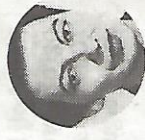
Mira Mihelič 1912-1985